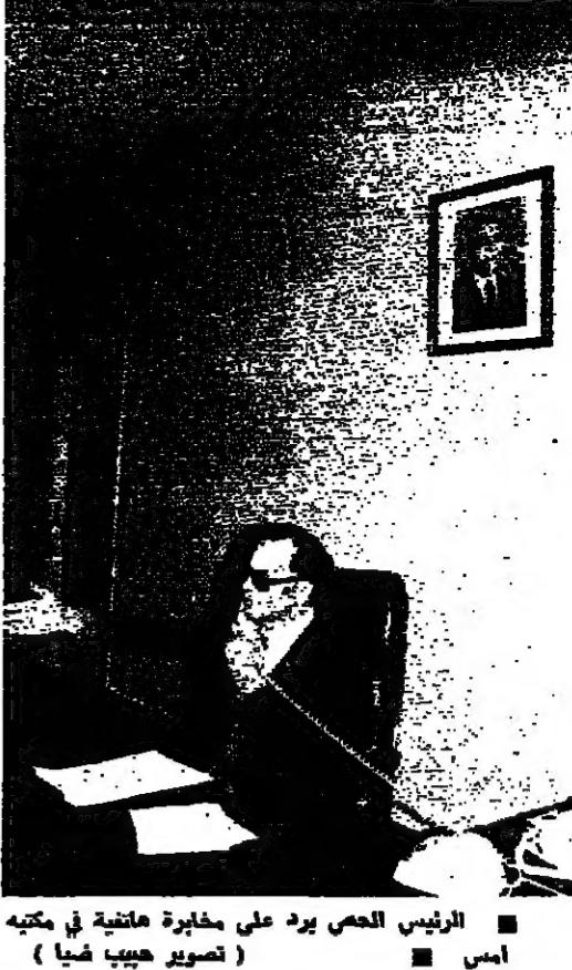
الرئيس الحص يرد على مخابرة هاتفية في مكتبه امس